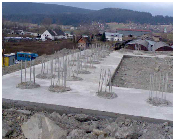
▲ Pohľad na hotové pilóty