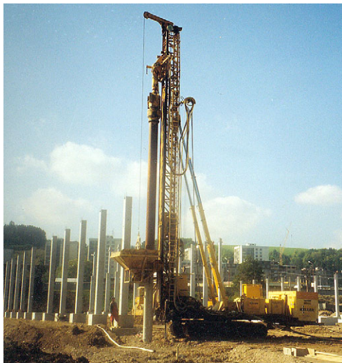
Začiatok našich prác