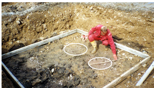
Zhotovené injektované štrkové vibrostĺpy pod základovou pätkou